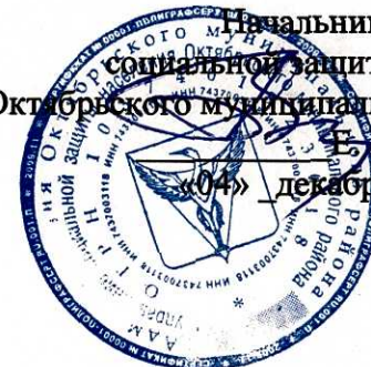
График проведения плановых проверок Управлением социальной защиты населения подведомственных учреждений в 2021 году

Утверждаю Начальник управления социальной защиты населения Октябрьского муниципального района Е. В. Бабенкова «04» декабря 2020 года